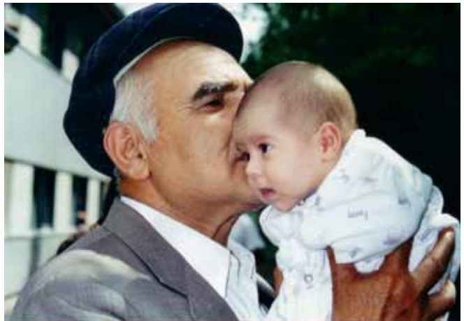
Gemeinschaft der Generationen